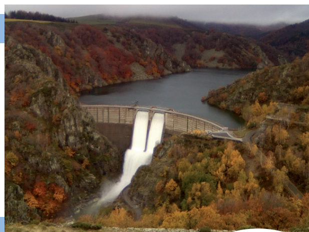
Barrage de Puylaurent en automne