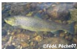
Truite Fario

L'Alose et l'Anguille sont des poissons migrateurs : leur cycle biologique se partage entre la mer et les rivières. Depuis la Méditerranée, ils doivent rejoindre nos cours d'eau qui leur offrent des milieux de qualité pour leur reproduction ou leur croissance.