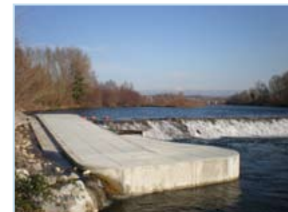
sur le seuil de Lanas - St Maurice d'Ardèche