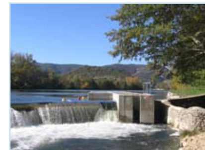
sur le seuil dit de Gos (Vallon Pont d'Arc - seuil de la Tour du moulin de Salavas)