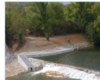
sur le seuil de Vallon Pont d'Arc - Salavas

D'ici à 2014, six autres barrages seront équipés sur l'Ardèche, afin de rouvrir la voie aux poissons sur 80km de rivière, du Rhône à Aubenas.