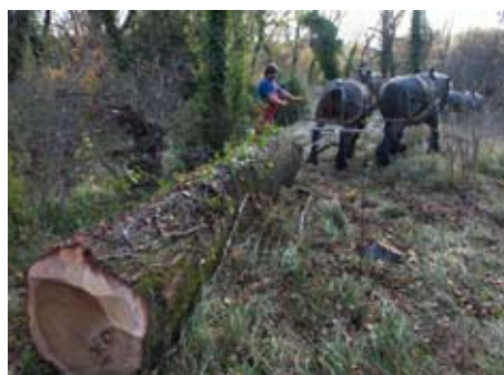
Débardage à cheval en zone sensible Confluence Ardèche Beaume à Labeaume (nov. 2009)