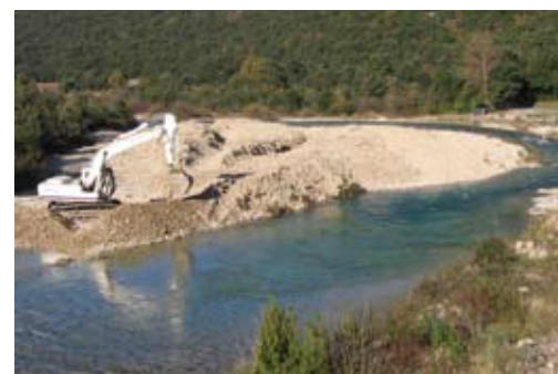
Remobilisation des bancs de graviers Ibie à Lagorce (nov. 2008)

Tous ces travaux sont planifiés sur l'ensemble de la durée du Contrat de Rivière (2008-2014). Ils sont réalisés dans le cadre de Déclarations d'Intérêt Général (DIG).