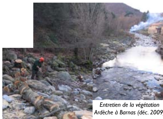
Entretien de la végétation Ardèche à Barnas (déc. 2009)