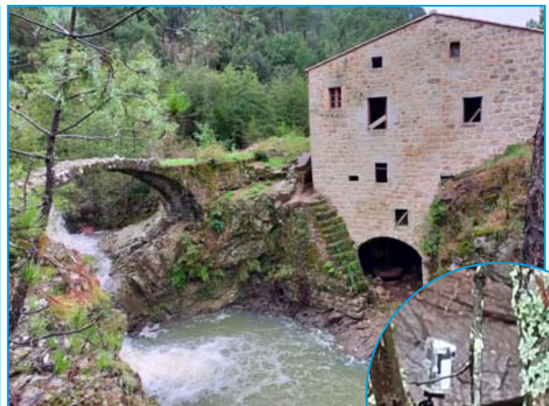
Semaine du 4 octobre 2021 : Des suivis de l'évolution de la qualité écologique du cours d'eau seront menés après les travaux. Des appareils photos «time-lapse» ont été posés afin d'observer l'effet des crues d'automne qui permettront à la rivière Alune de recréer petit à petit un lit fonctionnel.