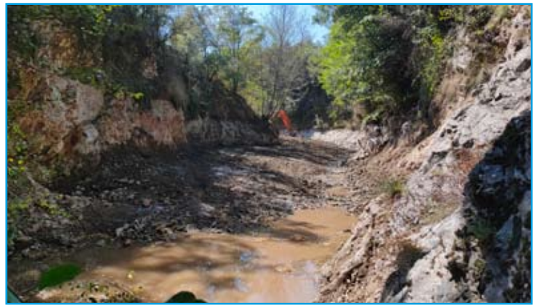
Démolition du barrage au moyen d'une pelle de 22 tonnes équipée d'un brise roche hydraulique. Remise en forme du lit et retalutage léger de la berge.