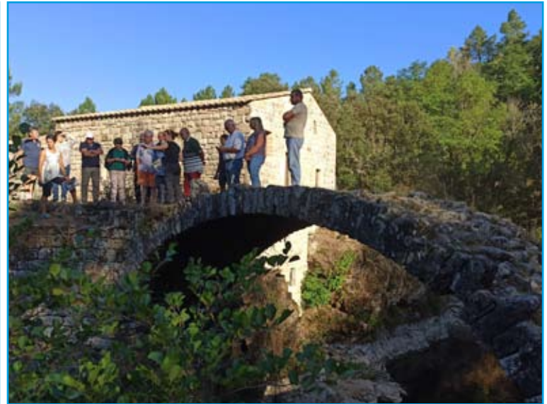
Vendredi 27 août 2021 : Visite du chantier terminé avec les élus locaux et les représentants de l'association du Moulin Dupuy (sur la photo de gauche, ils se tiennent sur la ligne où se situait avant le barrage)