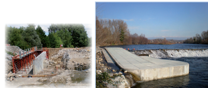
sur le seuil de Lanas - St Maurice d'Ardèche