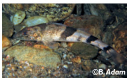
Apron du Rhône

Les poissons ont besoin de se déplacer le long des cours d'eau.