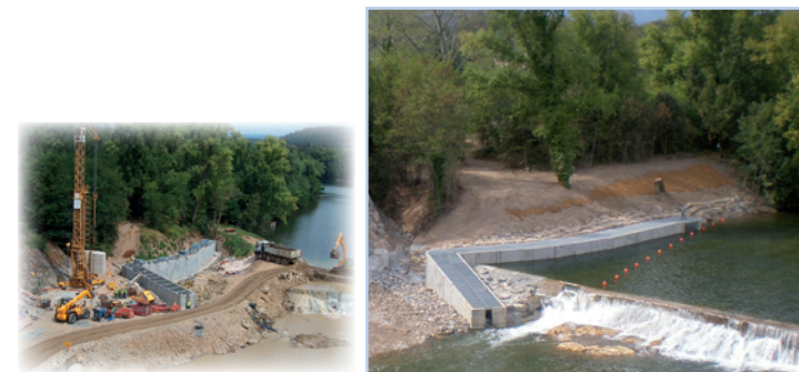
sur le seuil de Vallon Pont d'Arc - Salavas

D'ici à 2014, six autres barrages seront équipés sur l'Ardèche, afin de rouvrir la voie aux poissons sur 80km de rivière, du Rhône à Aubenas.