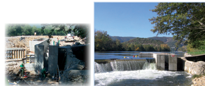
sur le seuil dit de Gos (Vallon Pont d'Arc - seuil de la Tour du moulin de Salavas)